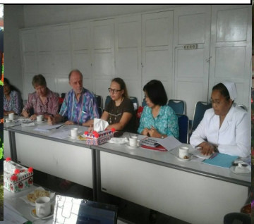
Partnership consultation 2015