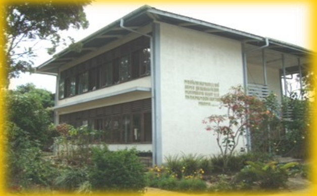
Asrama yang asri