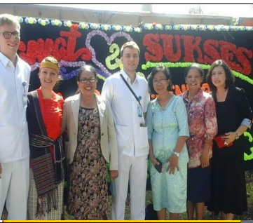
Kunjungan perawat Jerman Ke Akper HKBP