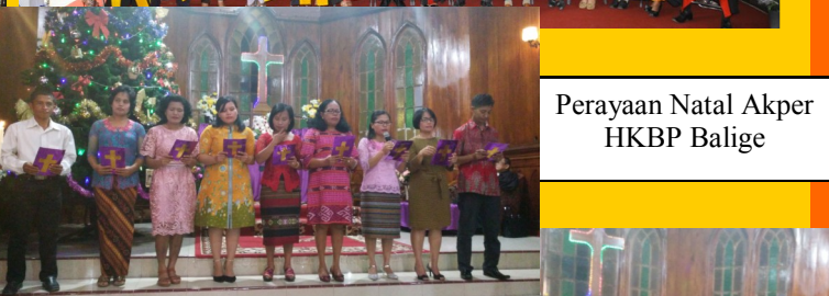
Perayaan Natal Akper HKBP Balige