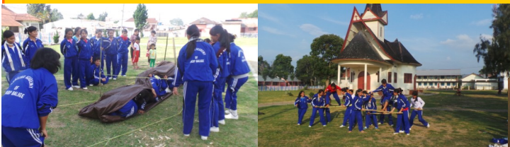
Pelaksanaan Retreat Akper HKBP Balige

JL.GEREJA NO.17 BALIGE TOBA SAMOSIR – SUMATERA UTARA Telp : (0632) 21137 Website : www.akperhkbp.ac.id